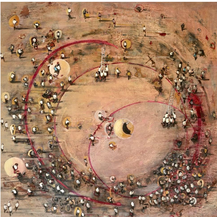
Circulos 2021 olio su tela cm 80x80 euro 3000