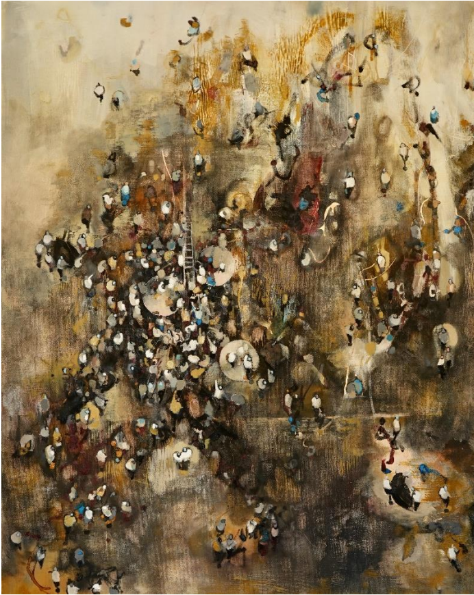
Stolen Time III 2021 olio su tela cm 80x100 euro 3500