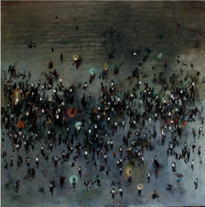
Mar 2019 olio su tela cm 150x150 euro 7500