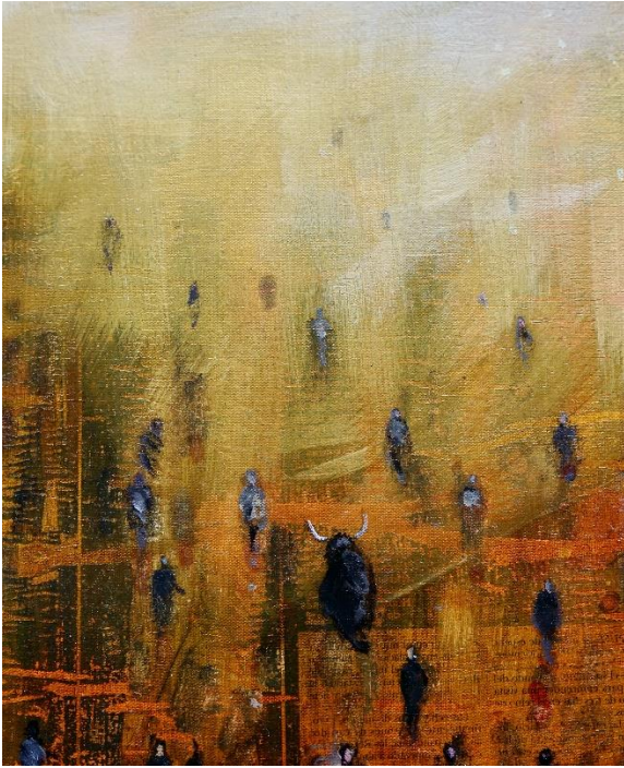
Naranja 2021 olio su tela cm 20x25 euro 500