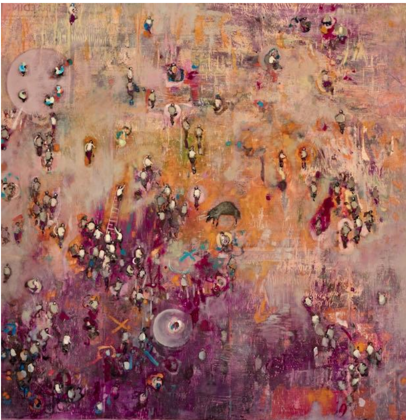
Stolen Time VIII 2021 olio su tela cm 80x80 euro 3000