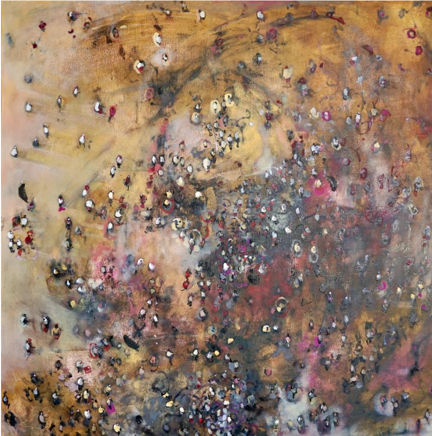
Centro de Gravedad Permanente 2021 olio su tela cm 100x100 euro 4000