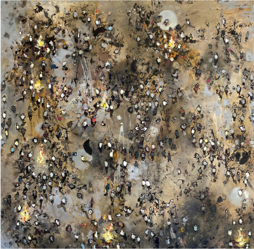
Stolen Time IV 2021 olio su tela cm 80x80 euro 3000