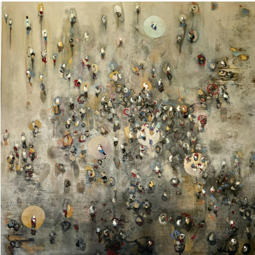
Stolen Time VI 2021 olio su tela cm 80x80 euro 3000