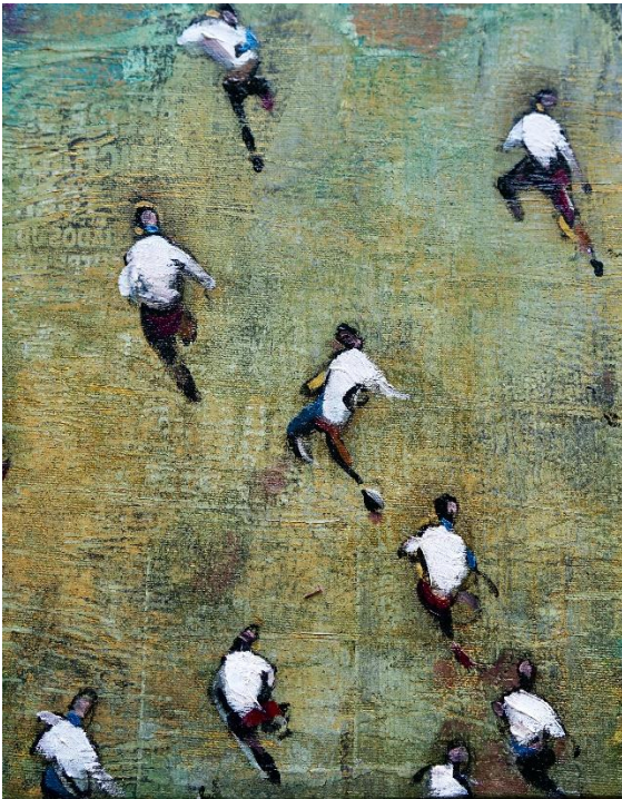
Verde 2021 olio su tela cm 20x25 Euro 500