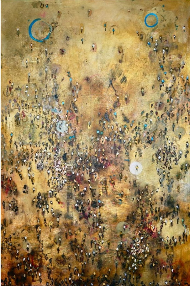
Circulos Azules 2021 olio su tela cm 100x150 euro 6000