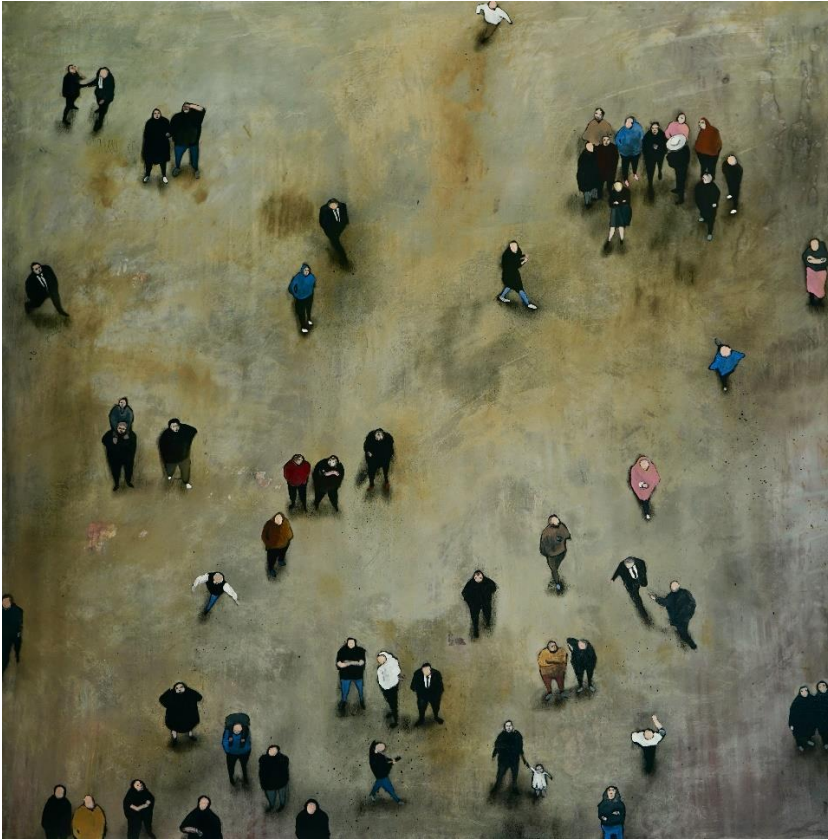
Hope 2019 olio su tela cm 120x120 euro 5000