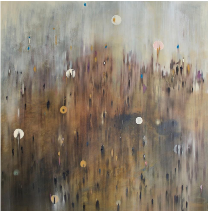
Autumn 2018 olio su tela cm 150x150 Euro 7500