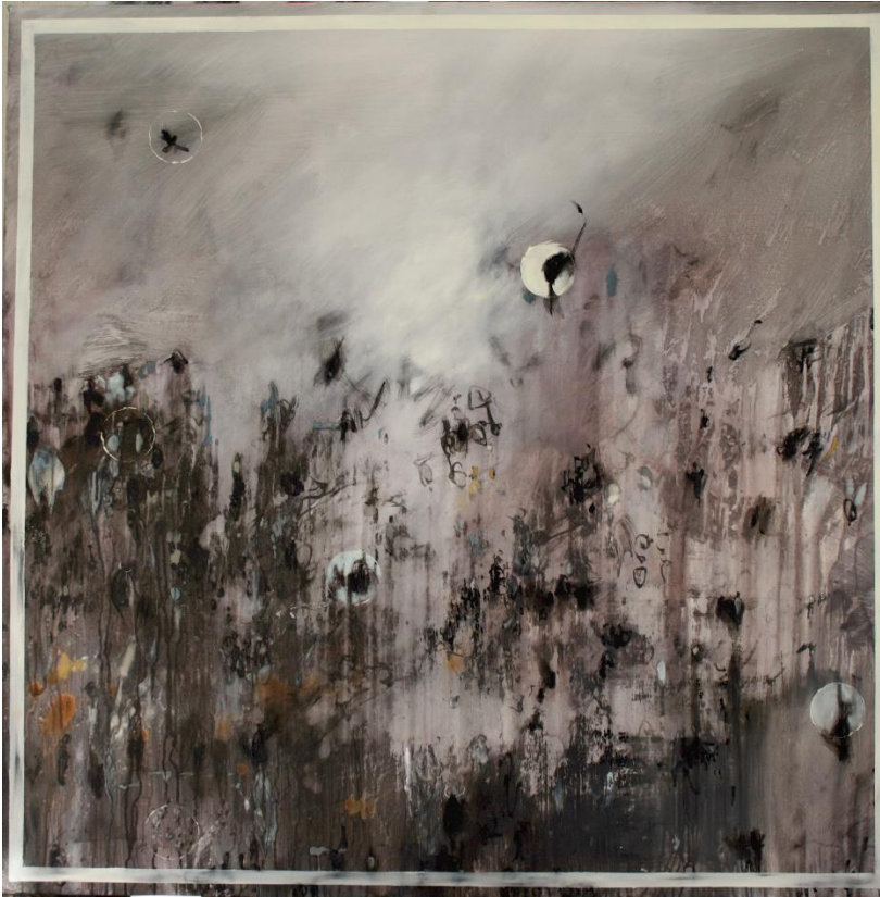
Gris 2019 olio su tela cm 120x120 euro 5000