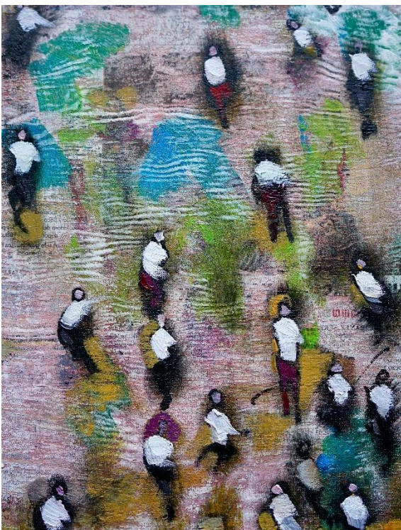
Rosa 2021 olio su tela cm 20x25 euro 500