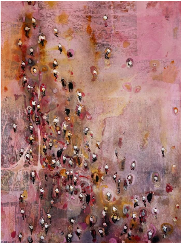
Nomadas 2021 olio su tela cm 60x80 euro 2500