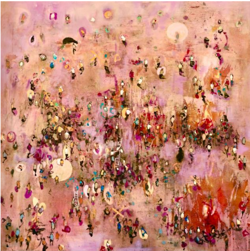
Stolen Time VII 2021 olio su tela cm 80x80 euro 3000